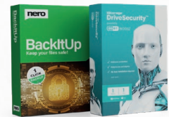
Kostenlose 1-jährige Lizenz für Nero BackItUp und iStorage DriveSecurity