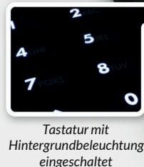
Tastatur mit Hintergrundbeleuchtung eingeschaltet

Das TAA-konforme Laufwerk ist mit einer Kapazität von bis zu 16 TB erhältlich und setzt neue Maßstäbe für eine einfache und zuverlässige Datensicherung.