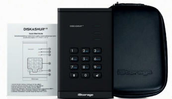
portabler diskAshur 3 (HDD/SSD), Etui und Kurzanleitung