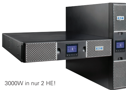
3000W in nur 2 HE!