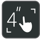
LCD de pantalla táctil