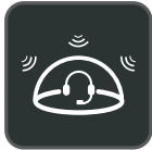
Tecnología Acoustic Shield

Yealink WH66 es el auricular inalámbrico DECT líder en la industria, con dos modelos WH66 Dual y WH66 Mono, lo que abre una forma completamente nueva de colaboración de escritorio. Trabaje sin problemas con las principales plataformas de UC e integre de forma nativa con los teléfonos IP de Yealink. La pantalla táctil capacitiva de 4.0 pulgadas (480 x 800) de la base ofrece una nueva experiencia de trabajo, con solo un toque, todo el control. Actúe como una estación de trabajo, gestione las llamadas telefónicas, conecte con varios dispositivos (teléfono de escritorio / teléfono móvil / ordenador), cargue el teléfono móvil de forma inalámbrica e incluso desempeñe la función de altavoz. Lo mejor de todo es que la implementación de una estación de trabajo tan multifuncional solo necesita conectarse directamente. Las cosas más fáciles de hacer, la mayor comodidad para disfrutar.