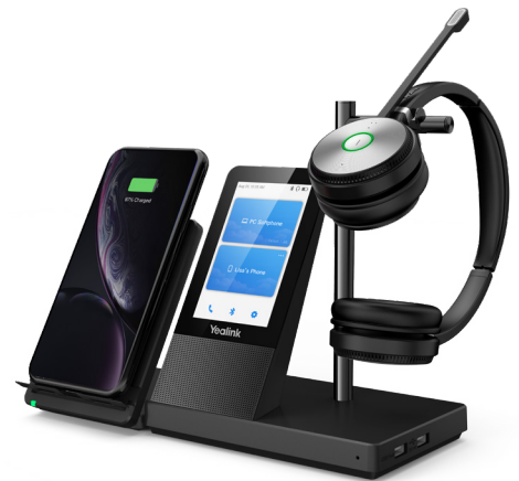
WH66 Mono/ Dual: Teams WH66 Mono/ Dual: UC