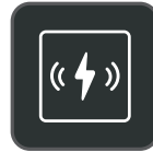
Cargador inalámbrico Qi