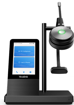
WH66 con cargador * El cargador inalámbrico es opcional

La luz de ocupado está habilitada en WH66. Con la luz del auricular o BLT60 en el escritorio encendiéndose en rojo, las personas a tu alrededor sabrán que estás hablando por teléfono, en lugar de interrumpirte sin saberlo. Simplemente manténgase enfocado en la conversación, para una mayor eficiencia, para una mejor colaboración.