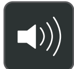
Modo de altavoz