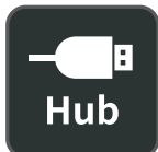
Hub USB integrado