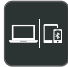
Conexión de varios dispositivos