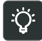
Luz de ocupado personalizable