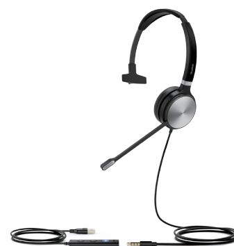
UH36 Mono Teams UH36 Mono UC

Intégration en profondeur avec les téléphones IP Yealink, pour que leurs fonctionnalités avancées, comme la synchronisation du volume et le contrôle des appels multiples soient à portée de main.