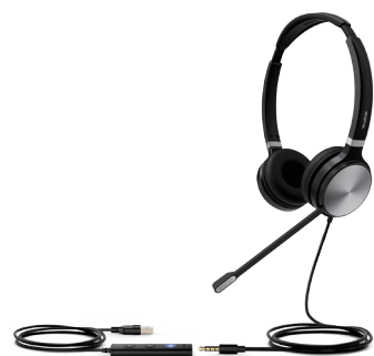
UH36 Dual Teams UH36 Dual UC