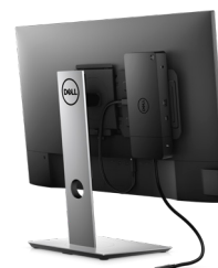
MONTAGESATZ FÜR DELL DOCKINGSTATION | MK15

Der 4K-Monitor mit 27" bietet eine breite Farbabdeckung und sorgt so für beeindruckende Farben und eine gestochen scharfe Bildqualität. Er bietet VESA DisplayHDR™ 400, InfinityEdge und USB-C-Konnektivität mit einer Leistungsabgabe von bis zu 90 W.