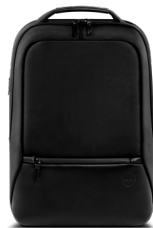
DELL PREMIER SLIM-RUCKSACK 15 | PE1520PS

Mit dem aufladbaren aktiven Stift können Sie ganz einfach Notizen machen und immer organisiert bleiben, ob in Meetings oder unterwegs. Er lässt sich in 5 Minuten kabellos zu 100 % aufladen, während er in der Halterung in der Tastatur liegt, die dafür sorgt, dass Sie keinen Stift verlieren.