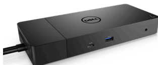
DELL THUNDERBOLT DOCK | WD19TB

Nutzen Sie die leistungsstarke Dell Thunderbolt-Dockingstation für ungebremstes Arbeiten. Laden Sie Ihr System schneller auf, unterstützen Sie bis zu zwei 4K-Displays und schließen Sie das System über ein einziges Kabel an Ihre Peripheriegeräte an.