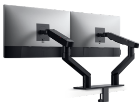
DELL MONITORARM FÜR ZWEI BILDSCHIRME | MDA20

Schließen Sie Ihr Dell Dock einfach an den Montagesatz für das Dell Dock an und montieren Sie es hinter einem Monitor, an einer Wand oder unter dem Schreibtisch, um einen Arbeitsplatz ohne Kabelgewirr zu schaffen.