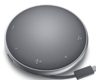
DELL MOBILE ADAPTER MIT FREISPRECHFUNKTION | MH3021P

Mit dieser umfassenden Lösung für zwei Monitore und die Systemmontage bleibt Ihr Schreibtisch aufgeräumt. Dies ist der weltweit erste Monitorarm, bei dem Sie den Schwenkwinkel mit nur einem Handgriff verstellen können 26 .