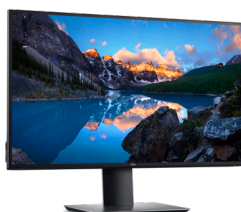
DELL ULTRASHARP 27 4K-USB-C-MONITOR | U2720Q

Nutzen Sie die leistungsstarke Dell Thunderbolt-Dockingstation für ungebremstes Arbeiten. Laden Sie Ihr System schneller auf, unterstützen Sie bis zu zwei 4K-Displays und schließen Sie das System über ein einziges Kabel an Ihre Peripheriegeräte an.