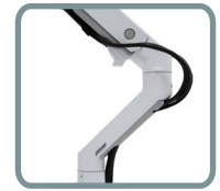
SUJETADORES A LO LARGO DEL BRAZO PARA MANTENER LOS CABLES ORDENADOS Y FUERA DEL CAMINO