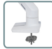
SOPORTE DE ARANDELA PARA INSTALACIÓN EN EL AGUJERO DEL ESCRITORIO INCLUIDO