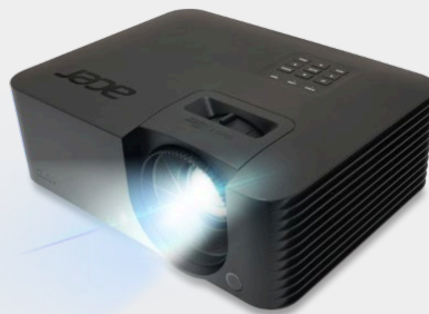
Vidéoprojecteur Laser 4000 Lumens - Véro PL2520i