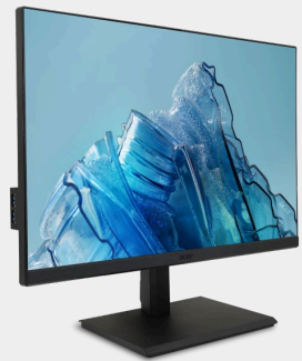
Moniteur ergonomique Véro B7