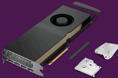
NVIDIA® RTX™ A4500 Grafik