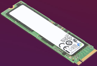
SSD Performance PCIe Gen4 NVMe OPAL2 M.2 2280 mit 2 TB