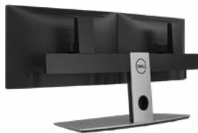
DELL STÄNDER FÜR 2 MONITORE | MDS19

Genießen Sie eine werkzeuglose Monitorinstallation mit Quick Release und der Flexibilität, die einzelnen Monitore unabhängig voneinander zu drehen, zu neigen und zu schwenken sowie ihre Höhe anzupassen. Highlights sind die kleine Stellfläche und die saubere Kabelführung.