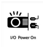
I/O Power On

Mit der HDMI Power On Funktion ist der Projektor in der Lage sich automatisch einzuschalten, sobald der Projektor ein Signal per HDMI oder VGA zugespielt bekommt. Sie brauchen den Projektor nicht mehr separat zu starten, sondern können einfach ihr Notebook, ihren Receiver oder die Spielekonsole einschalten und der Projektor schaltet sich automatisch ebenfalls ein.