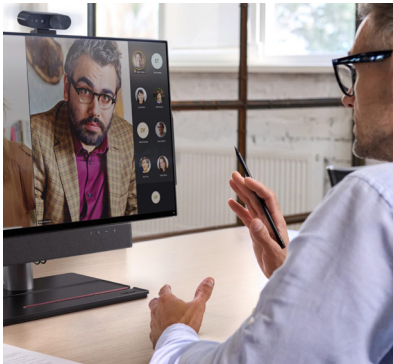
Schreibtische für Führungskräfte, Telemedizin, Fernunterricht und Telefonkabinen