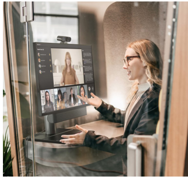
Virtuelle Rezeptionen, Hotelwesen und Hotdesks