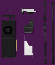
NVIDIA RTX™ 5000 ADA 32 GB DP*4 GDDR6 Grafikkarte