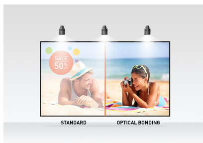
Optical bonded PCAP

Le support flexible peut être positionné selon plusieurs angles, créant ainsi une expérience confortable et ergonomique pour l'utilisateur. Le système de gestion des câbles intégré dissimule tous les câbles et les fils électriques, créant ainsi un espace de travail ordonné et sans câbles. Le ProLite T2438MSC peut être utilisé en orientation paysage, portrait et face vers le haut. Une solution parfaite pour la signalisation interactive, la vente au détail en magasin, les points de vente et les présentations interactives.