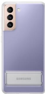
Clear Standing Cover EF-JG991