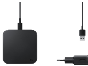
Wireless Charger Pad EP-P1300T