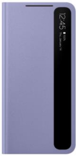
Clear View Cover EF-ZG991