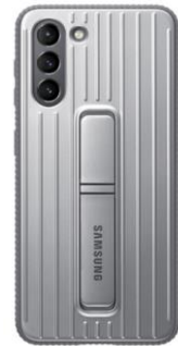
Protective Standing Cover EF-RG991