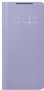
LED View Cover EF-NG991