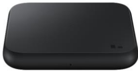
Wireless Charger Pad EP-P1300B