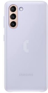
LED Cover EF-KG991