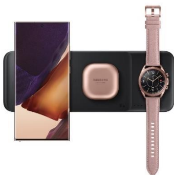
Wireless Charger Trio EP-P6300