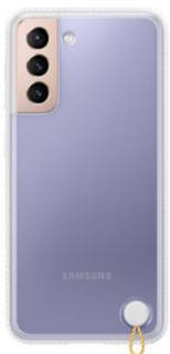
Clear Protective Cover EF-GG991