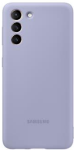
Silicone Cover EF-PG991