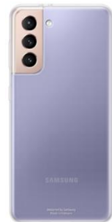
Clear Cover EF-QG991