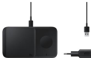
Wireless Charger Duo EP-P4300T