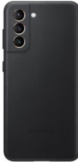
Leather Cover EF-VG991