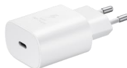
Schnelllade- adapter 25 Watt EP-TA800N