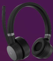
Auriculares ANC inalámbricos Lenovo Go REF.: 4XD1C99221

Para consultar la lista completa de accesorios y opciones, visita: accsmartfind.lenovo.com