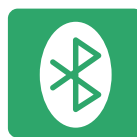
Integriertes Bluetooth 5,1