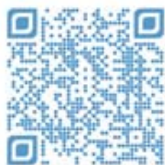
Voir la vidéo 9PX