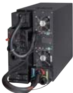
9PX 11kVA avec By-Pass de maintenance