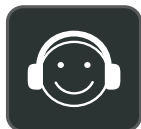
Comfort per tutto il giorno