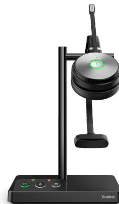
WH62 Mono Teams WH62 Mono UC