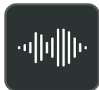
Esperienza audio Optima