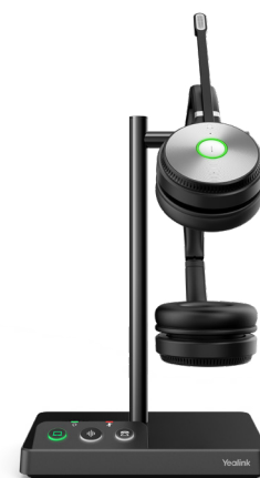
WH62 Dual Teams WH62 Dual UC