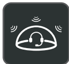
Tecnologia Acoustic Shield

La Yealink WH62 è una nuova cuffia auricolare wireless DECT entry-level, con i due modelli WH62 Doppia e WH62 Mono. Funziona senza problemi con le principali piattaforme UC e si integra in modalità nativa con i telefoni IP Yealink. Per un'esperienza di suono cristallino, la tecnologia Yealink Super banda larga e la tecnologia Acoustic Shield consentono di parlare e udire chiaramente durante le telefonate e le videoconferenze. Con un facile controllo sull'orecchio, senza interruzioni, comoda da indossare, la WH62 è un partner interessante sia per comunicare sia per collaborare.