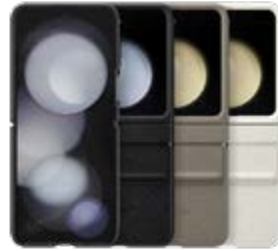
Flap Eco-Leather Case EF-VF731