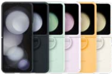
Silicone Case with Ring EF-PF731