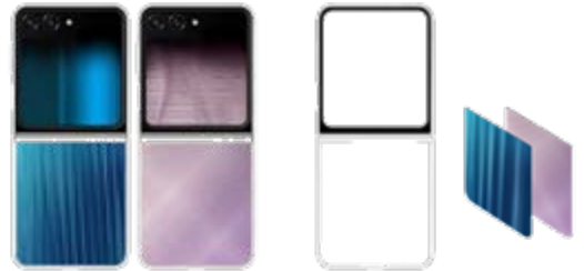
FlipSuit Case EF-ZF731