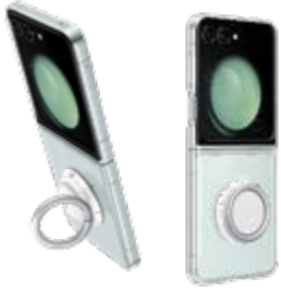
Clear Gadget Case EF-XF731