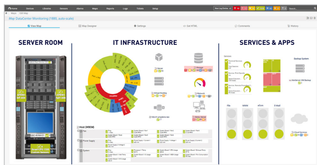
Mit PRTG-Maps individuelle Dashboards erstellen