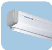
Professionelle Qualität in einem kompakten Gehäuse