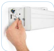
Plug and Play-Zubehör