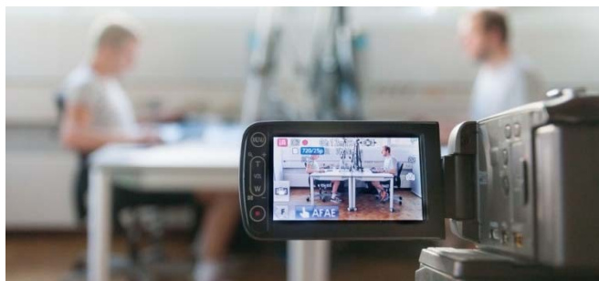
Abb. 1 Beobachtung der Körperhaltung von zwei Teilnehmern beim Bearbeiten einer CAD-Aufgabe

Die Teilnehmer erhielten eine standardisierte und randomisierte CAD-Aufgabe, die unter Beobachtung mit einem herkömmlichen Aufbau bestehend aus Tastatur und Maus in NX 10 zu lösen war. Nach einer einwöchigen Schulung mit einer bereitgestellten 3D-Maus wurde eine zweite, ähnliche Aufgabe gestellt, die die Teilnehmer mit einer 3D-Maus lösen sollten. Der Schwierigkeitsgrad der beiden Aufgaben war vergleichbar, für die Lösung waren aber andere Werkzeuge erforderlich. Während der Aufgabenbearbeitung wurden alle Bewegungen und Klicks mit der Maus aufgezeichnet und die Körperhaltung beobachtet (siehe Abb. 1 und 2).