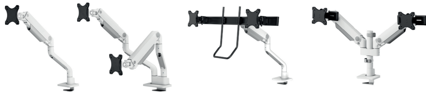
DS70S-950BL1 / WH1 Bildschirmgröße: 17-49" Kapazität: 18 kg/Curved 15 kg Verstärkter Kopf