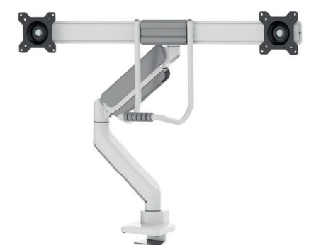
DS75-450BL2 / WH2 Bildschirmgröße: 17-32" Kapazität: 8 kg (2x)