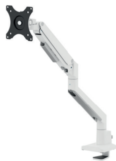
DS70-250BL1 / WH1 / SL1 Bildschirmgröße: 17-35" Kapazität: 9 kg