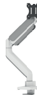
DS70-450BL1 / WH1 Kapazität: 18 kg/Curved 14 kg Kapazität: 15 kg