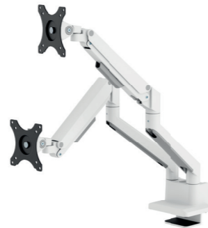
DS70-250BL2 / WH2 / SL2 Bildschirmgröße: 17-32" Kapazität: 9 kg (2x)