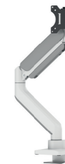
DS70PLUS-450BL1 / WH1 Bildschirmgröße: 17-49" Kapazität: 18 kg (Curved 14 kg) Verstärkter Kopf