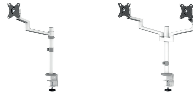
DS60-425BL1 / WH1 Bildschirmgröße: 17-27" Kapazität: 8 kg