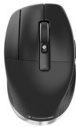
CadMouse Pro Wireless Left