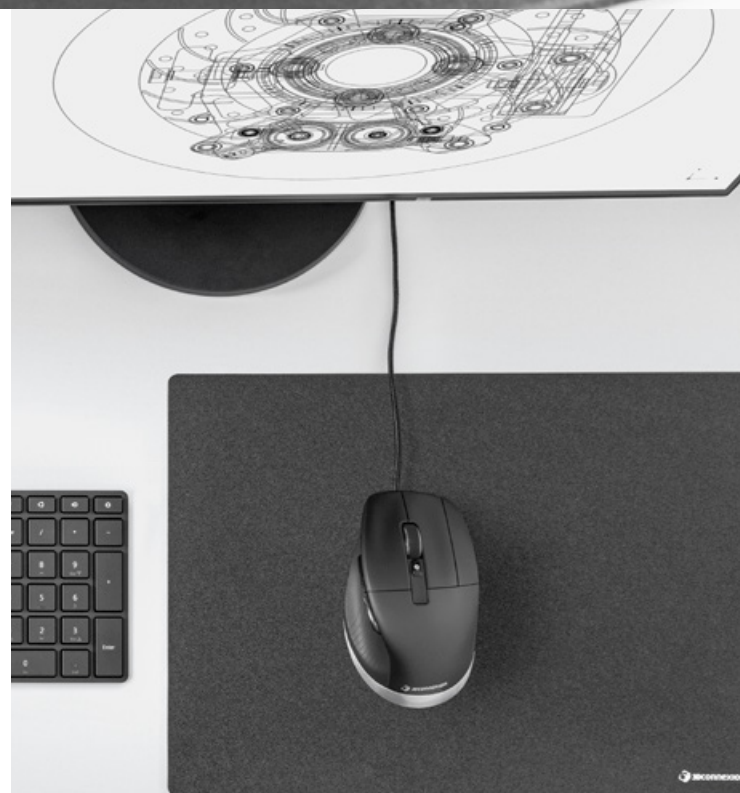
CadMouse Pro, CadMouse Pad

Für Details über unterstützte Anwendungen besuchen Sie bitte unsere Website oder kontaktieren Sie uns direkt.