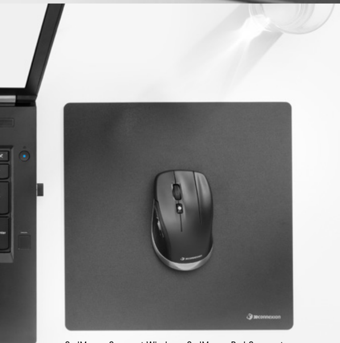
CadMouse Compact Wireless, CadMouse Pad Compact

Dedizierte mittlere Maustaste – der Klick mit dem Mousrad gehört dank intelligentem, ergonomischem Design der Vergangenheit an.