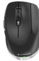
CadMouse Compact Wireless