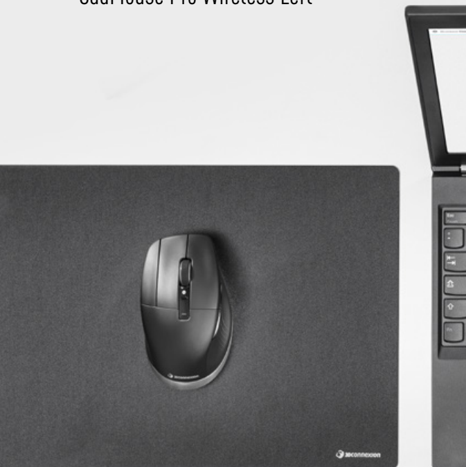
CadMouse Pro Wireless Left, CadMouse Pad

Auch für Linkshänder erhältlich: CadMouse Pro Wireless Left