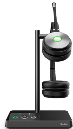
WH62 Dual Teams WH62 Dual UC