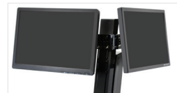
Dual Monitor Double-Hinged Bow #98-101-009 (schwarz) Erweitern Sie die Kontrolle über Ihre Monitorpositionierung für flexible und verstellbare Betrachtungswinkel (kompatibel mit 33-341-200, 33-349-200 und 33-349-211)

Weitere Informationen finden Sie unter ergotron.com . Oder kontaktieren Sie uns unter: +49 431 5402 8780 oder +49 800 182 4857 info.de@ergotron.com