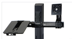
WorkFit-Kit zur Konvertierung von zwei Monitoren zu einer Monitor/Laptop-Konfiguration #97-617 (schwarz) Machen Sie aus einem WorkFit-S Dual einen Monitor- und Laptop-Arbeitsplatz (kompatibel mit 33-341-200, 33-349-200 und 33-349-211)