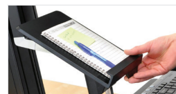
Tablet-/Dokumentenhalter für WorkFit-S #97-558-200 (schwarz) Fügen Sie einen Dokumentenhalter an der Vorderseite eines WorkFit-S hinzu, um einen Notizblock oder andere Gegenstände stets griffbereit zu haben (kompatibel mit 33-342-200 und 33-341-200)