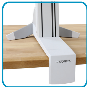
TISCHKLEMME ZUR BEFESTIGUNG AN OBERFLÄCHENKANTEN VON 1,2–6 CM HÖHE