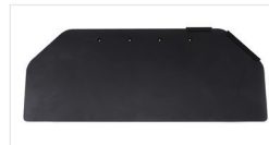
Tastatur-Eckunterlage für WorkFit #97-898 (schwarz) Eine Tastaturablage, mit der die Tastatur in einem Eckarbeitsplatz unterhalb des Tisches angebracht werden kann (kompatibel mit 33-342-200 und 33-341-200)