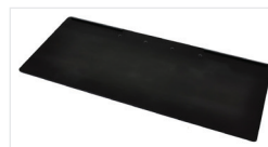
Tiefe Tastaturunterlage für WorkFit #97-897 (schwarz) Erweitern Sie jeden WorkFit-S mit einer größeren, extra tiefen Tastaturablage