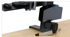
Kleine CPU Halterung #80-063-200 (schwarz)