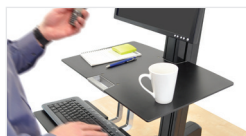
Arbeitsfläche für WorkFit-S #97-581-019 (schwarz) Fügen Sie einem WorkFit-S, Single LD oder Dual eine Arbeitsfläche mit Handgriff hinzu (kompatibel mit 33-342-200 und 33-341-200)