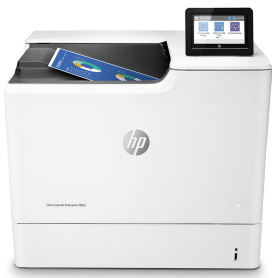
HP Color LaserJet Enterprise M653dn

Dieser HP Colour LaserJet-Drucker mit JetIntelligence kombiniert außergewöhnliche Leistung und Energieeffizienz mit Dokumenten in professioneller Druckqualität zum richtigen Zeitpunkt – Ihr Netzwerk bleibt dabei durch die branchenweit umfassendsten Sicherheitsfunktionen geschützt. 1