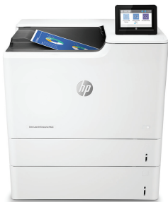
HP Color LaserJet Enterprise M653x