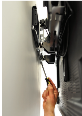
SCHRAUBEN ZUR UNTERSTÜTZUNG DER DIEBSTAHLSICHERUNG IM LIEFERUMFANG ENTHALTEN