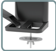
CON FORO PASSANTE 98-492-009 (NERO OPACO)