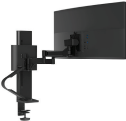
Singolo con morsetto a pannello