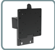
SINGOLO 47-109-224 (NERO OPACO)