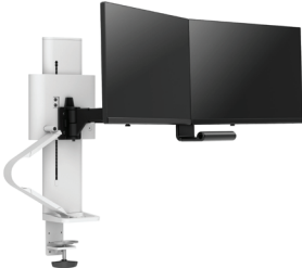
Doppio con morsetto a pannello