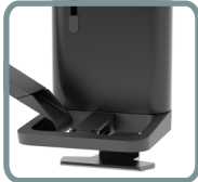
PROFILO SOTTILE 98-490-224 (NERO OPACO)