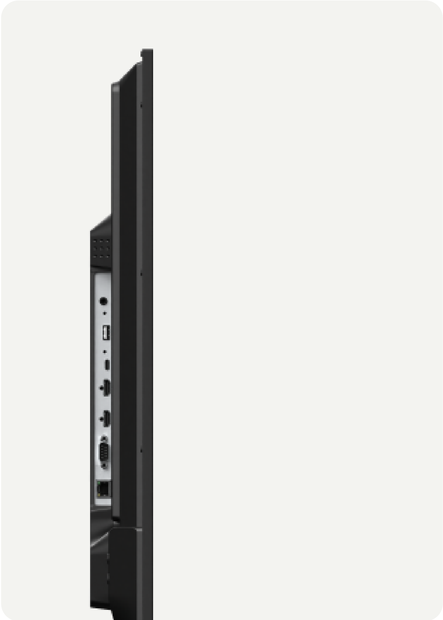
LCD 43 Essential Large Format Display - Sharp MultiSync® E439 (2 / 6)