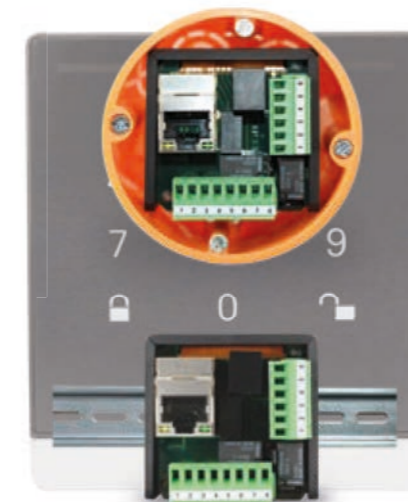
Montagebeispiel in 60 mm Schalterdose und Hutschiene

Das StarterSet besteht aus einem IP-Wandler, einem AccessManager SmartRelay und einem RFID-Token. Dieses Set kann mit einem zusätzlichen Erweiterungsleser (nur IP-Wandler ohne SmartRelay) kombiniert werden, um eine weitere Tür ins System einzubinden. Beim Erweiterungsleser erfolgt die Spannungsversorgung ebenfalls direkt über das SmartRelay.