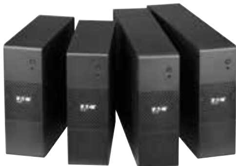
Produktübersicht USV Eaton 5S