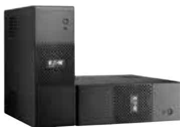
Die Eaton 5S ist flexibel.