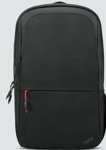
SAC À DOS THINKPAD ESSENTIAL 40,64 CM (16") (ECO) RÉF. : 4X41C12468

Conçue pour les professionnels modernes, la station d'accueil professionnelle universelle USB-C Lenovo a toutes les qualités pour booster votre productivité. Dotée de ports d'extension améliorés, d'une alimentation optimale et d'une prise en charge de deux écrans, et ce, dans un boîtier élégant et peu encombrant, cette station d'accueil est idéale pour les espaces de travail hybrides.