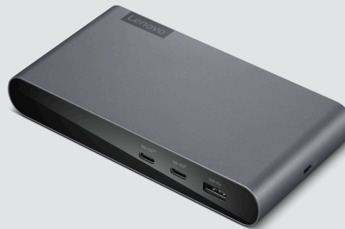
STATION D'ACCUEIL PROFESSIONNELLE UNIVERSELLE USB-C LENOVO RÉF. : 40B30090XX

Cette élégante souris pleine taille offre une solution sans fil moderne d'une qualité exceptionnelle. Compacte et ambidextre, elle est parfaitement ergonomique et facile à transporter. Réalisez vos tâches facilement grâce à la précision du capteur optique 1 200 ppp. Connectez des appareils Lenovo compatibles en utilisant un simple récepteur nano.