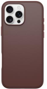
Union Station 77-96590 (Retail) 840304774104