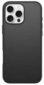
Black 77-96580 (Retail) 840304774005 77-96581 (ProPack) 840304774012