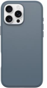
Bluetiful 77-96586 (Retail) 840304774067