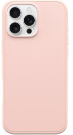
Ballet Shoes 77-96576 (Retail) 840304773961