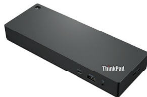
Estación de acoplamiento universal ThinkPad™ Thunderbolt 4