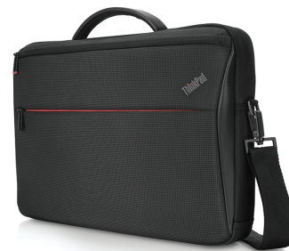
Maletín compacto de carga superior profesional para ThinkPad de 35,56 cm (14")