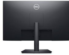
Rückansicht – Kabelführungsschlitz

Einfaches Einstellen des Bildschirms auf die bevorzugte Anzeigeposition.