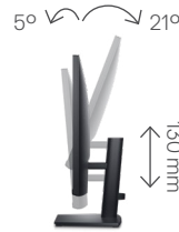
Neigbar und höhenverstellbar