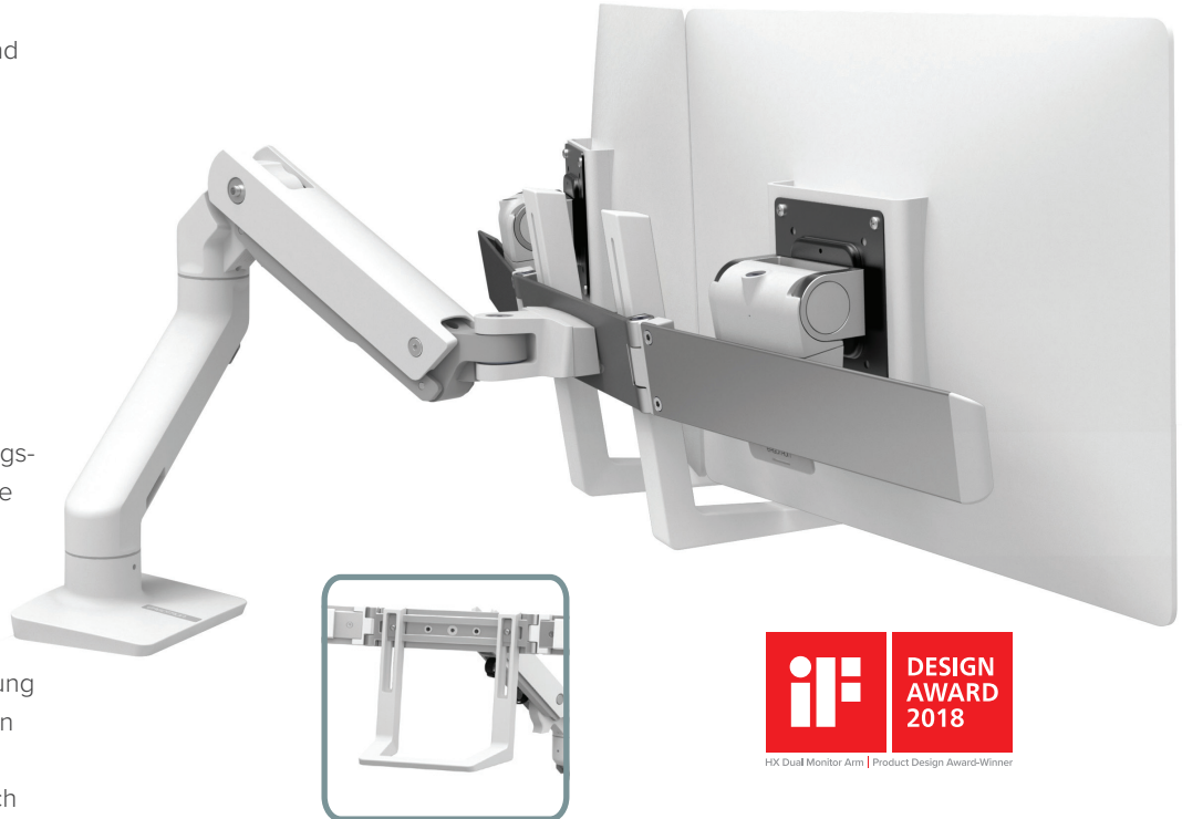
HX DUAL MONITORARM, TISCHHALTERUNG IN WEISS