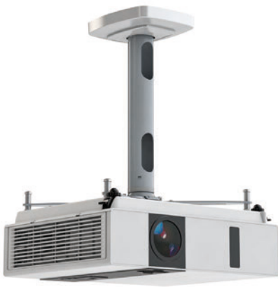
Kindermann Comfort 2 30