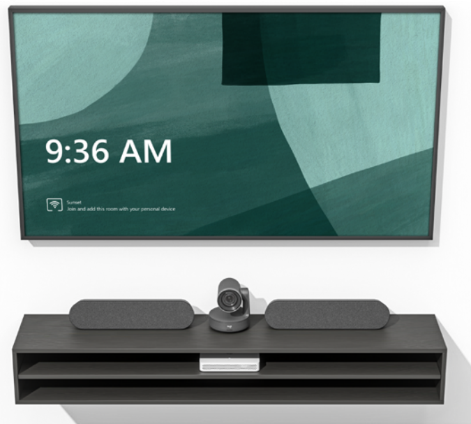
Logitech RoomMate mit Rally Plus-System