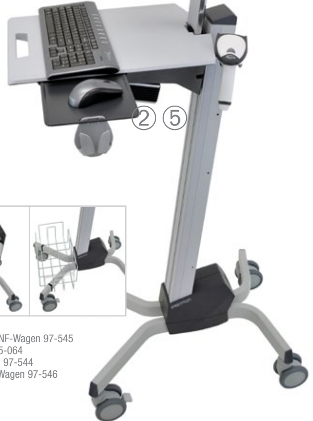
Laptop-Kit, vertikal, für NF-Wagen 97-546