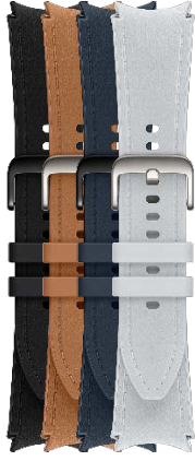
Hybrid Eco-Leather Band S/M | M/L