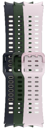
Extreme Sport Band S/M | M/L