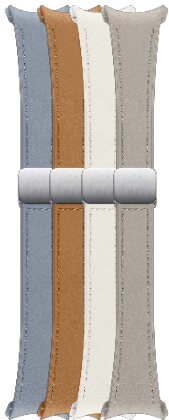
D-Buckle Hybrid Eco-Leather Band (Slim, S/M)