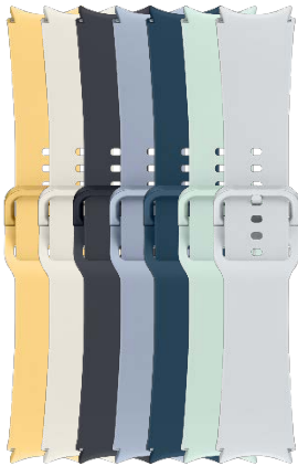
Sport Band S/M | M/L