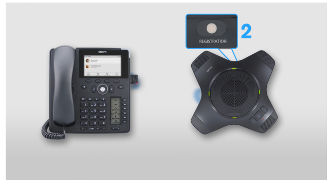
Abilita il link DECT al vivavoce wireless