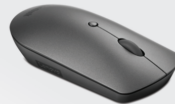
SOURIS SILENCIEUSE BLUETOOTH THINKBOOK RÉF. : 4Y50X88824

Très léger et imperméable, ce sac à dos Lenovo Business Casual de 39,62 cm (15,6") est fabriqué en polyester durable. Le compartiment entièrement rembourré offre une excellente protection pour vos appareils. Une ouverture à été spécialement prévue pour recharger vos appareils en déplacement. De forme carrée et de couleur sobre, il est adapté à toutes les occasions, qu'elles soient formelles ou informelles.