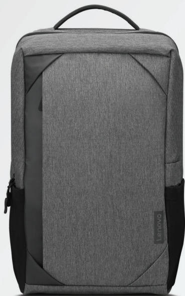
SAC À DOS LENOVO BUSINESS CASUAL DE 39,62 CM (15,6") RÉF. : 4X40X54258

Très léger et imperméable, ce sac à dos Lenovo Business Casual de 39,62 cm (15,6") est fabriqué en polyester durable. Le compartiment entièrement rembourré offre une excellente protection pour vos appareils. Une ouverture à été spécialement prévue pour recharger vos appareils en déplacement. De forme carrée et de couleur sobre, il est adapté à toutes les occasions, qu'elles soient formelles ou informelles.