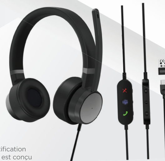
CASQUE ANC FILAIRE LENOVO GO RÉF. : 4XD1C99223

Avec son design ambidextre, fin, et ses boutons silencieux, cette souris moderne et discrète est un accessoire haut de gamme indispensable pour votre portable. Offrant une prise en main confortable et équipée d'un capteur optique bleu avec capacité de suivi sur verre, la souris fonctionne sur toutes les surfaces réfléchissantes. La connectivité Bluetooth double hôte (avec Microsoft SwiftPair) et le défilement bidirectionnel avec réglage jusqu'à 2 400 ppp à la volée vous offrent une précision et un contrôle accrus.