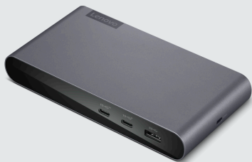
Lenovo USB-C Universal Business Dock ARTIKELNR.: 40B30090xx

Das Lenovo USB-C Universal Business Dock wurde für moderne Anwender entwickelt und bietet alles, was Sie zur Steigerung Ihrer Produktivität benötigen. Dank den erweiterten Anschlussmöglichkeiten, der optimalen Stromversorgung und der Unterstützung für zwei Bildschirme in einem kleinen, platzsparenden und eleganten Gehäuse ist das Dock der perfekte Begleiter für hybride Arbeitsumgebungen. Dank mehr als 11 praktischen Erweiterungsanschlüssen können Sie Ihren Arbeitsplatz und -ablauf einfacher als je zuvor optimieren. Es ermöglicht blitzschnelle Datenübertragungen, den Anschluss von zwei 4K-Monitoren und schnelles Aufladen für Notebooks mit bis zu 65 W mit dem mitgelieferten Adapter oder bis zu 100 W mit dem optionalen 135 W-Adapter. Darüber hinaus unterstützt es auch Firmware-Updates mit nur einem Klick, sogar ohne Dock Manager.