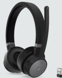
Lenovo Go Wireless ANC Headset ARTIKELNR.: 4XD1C99222, 4XD1C99221 (ohne Standfuß)

Das Lenovo USB-C Universal Business Dock wurde für moderne Anwender entwickelt und bietet alles, was Sie zur Steigerung Ihrer Produktivität benötigen. Dank den erweiterten Anschlussmöglichkeiten, der optimalen Stromversorgung und der Unterstützung für zwei Bildschirme in einem kleinen, platzsparenden und eleganten Gehäuse ist das Dock der perfekte Begleiter für hybride Arbeitsumgebungen. Dank mehr als 11 praktischen Erweiterungsanschlüssen können Sie Ihren Arbeitsplatz und -ablauf einfacher als je zuvor optimieren. Es ermöglicht blitzschnelle Datenübertragungen, den Anschluss von zwei 4K-Monitoren und schnelles Aufladen für Notebooks mit bis zu 65 W mit dem mitgelieferten Adapter oder bis zu 100 W mit dem optionalen 135 W-Adapter. Darüber hinaus unterstützt es auch Firmware-Updates mit nur einem Klick, sogar ohne Dock Manager.