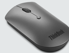
ThinkBook Bluetooth Silent Mouse ARTIKELNR.: 4Y50X88824

Das Lenovo Go Wireless ANC-Headset mit Teams-Zertifizierung wurde entwickelt, um Umgebungsgeräusche zu reduzieren und auch unterwegs Produktivität zu ermöglichen. Der USB-A-Bluetooth-Empfänger bietet eine ausgezeichnete Verbindung. Dank der Microsoft Teams-Zertifizierung und der hochmodernen Geräuschunterdrückungstechnologie haben sowohl die Mitarbeiter im Büro als auch ihre ortsunabhängigen Kollegen die Möglichkeit, Ablenkungen auszublenden und sich auf ihre Arbeit zu konzentrieren – und das alles mit nur einem Headset. Dieses unterstützt duale Konnektivität über Bluetooth 5.0 und USB-Audio für Multitasking und die fortschrittliche Geräuschunterdrückung mit ANC und ENC optimiert die Klangqualität und die Talk-Through-Funktion. Die Ladezeit bei Schnellladung beträgt 1,5 Stunden, die Wiedergabezeit bis zu 35 Stunden.