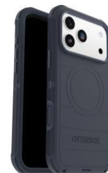
Riverside 77-98396 (Retail) 840434711567