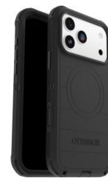
Black 77-98392 (Retail) 840434711482 77-98394 (ProPack) 840434711529