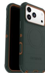
Coopersmith 77-98400 (Retail) 840434711642