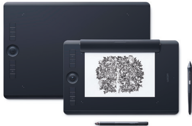
Abgebildete Produkte: Wacom Intuos Pro L & Wacom Intuos Pro Paper Edition M. Künstlerin: Mouni Feddag

Das Wacom Intuos Pro bietet dir die ultimative Kontrolle über deine Kreationen. Dank des drucksensitiven Wacom Pro Pen 2 und des schlanken Tablett-Designs kannst du in ungeahnter Detailtreue zeichnen. Bei der Arbeit mit der Wacom Intuos Pro Paper Edition hast du außerdem die Möglichkeit, mit dem Wacom Finetip Pen auf deinem Lieblingpapier Zeichnungen in Tinte anzufertigen und diese anschließend in digitale Dateien umzuwandeln – um sie dann in der Software deiner Wahl bearbeiten zu können.