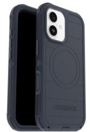
Riverside 77-98358 (Retail) 840434710805