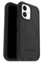
Black 77-98354 (Retail) 840434710720 77-98356 (ProPack) 840434710768