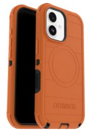
Hi Vis 77-98367 (ProPack) 840434710980