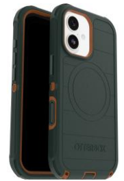
Coopersmith 77-98362 (Retail) 840434710881