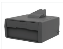
TALL ENKELE LADE DONKERGRIJS 97-989-622