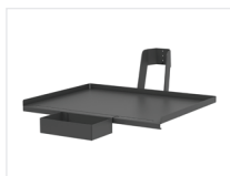
PLANK VOORKANT DONKERGRIJS 98-417-282