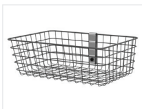
GROTE KABELMAND DONKERGRIJS 98-135-282