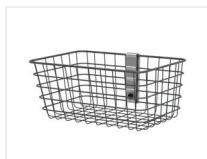
KLEINE KABELMAND DONKERGRIJS 98-136-282