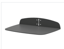
UTILITY PLANK DONKERGRIJS 97-507-282