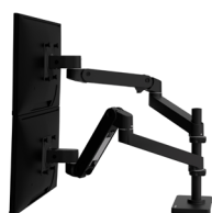
LX Pro Dual Stacking