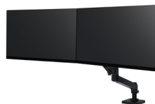
LX Pro Dual Direct