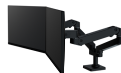
LX Pro Dual Side-By-Side