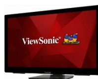
IFP2710 ViewBoard Mini Interaktives Präsentationsdisplay